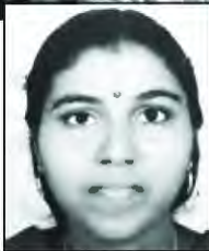
കവിത രഘു പുനയ്ക്കാവിള

ജപമാല രാജ്ഞിയാം അമ്മ മാതാവിനെ നിറകണ്ണായ് നോക്കുന്ന മെയ് മാസം ജപമണിമുത്തുകളൊന്നൊന്നായി കൈകളിലോടുന്ന മെയ് മാസം