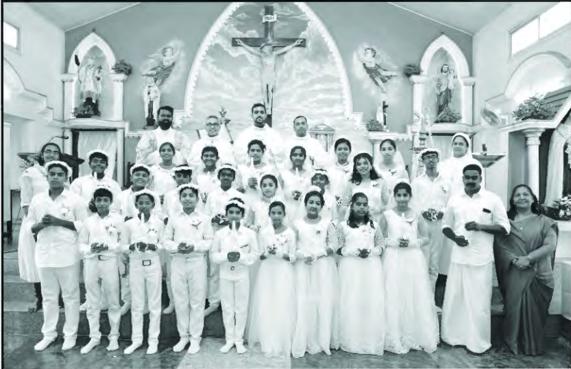
ആദ്യമായി ഈശോയെ സ്വീകരിച്ച പ്രിയ കുഞ്ഞുമക്കൾക്ക് പ്രാർത്ഥനാശംസകൾ...